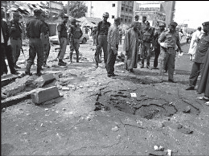
დაღუპულ მანქანებში მყოფმა თვითმკვლელებმა ტერაქტები ქალაქში აგადასსა და არლიტში მოხდეს. აგადასში ტერორისტების სამიზნე სამხედრო ყაზარმა გახდა.