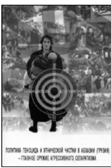
ПОСЛОВА ГОСУДАРСТВА И ЭТНИЧЕСКОЙ ЧИСТКИ В АБХАЗИИ ГРУЗИИ - ГЛАВНЫЕ ТЕМЫ МЕЖДУНАРОДНОЙ КОНФЕРЕНЦИИ