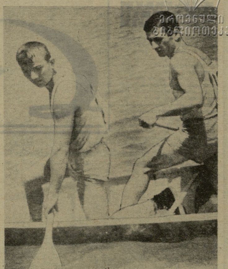
გასულ კვირას თბილისის ზღვაზე გაიმართა საბიძარო ნიჩბოსნობისა და კანოეში მოღვაწეთა და საქართველოს გუნდების მატჩი.