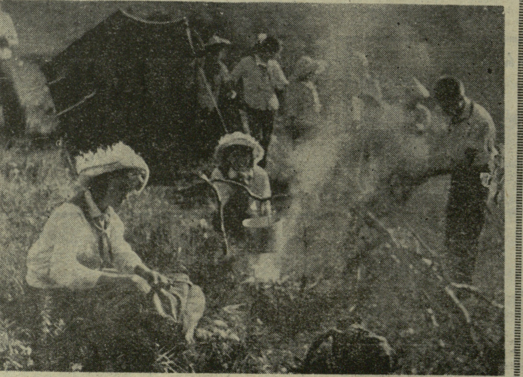
ბუნაპი დასცეს. პიონერული კარვები ვაშალს და მორაგებები სადილის თადარიგს და უტრბადლ-გავის რაიონი. ფოტო ზ. დედარიანისა. (ჩვენი სპეც. კორ.)