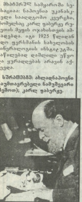
მხამირალ სახიერო სუბიექტია ნაიფიხა უკასკი