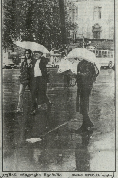
გუშინ, ინტერესი წვიმაში. შპაპარ ღვინოში ფოტო