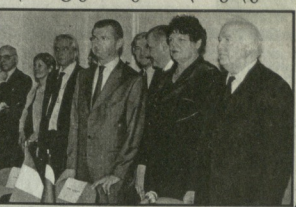
საერთაშორისო სტანდარტებს უახლოვდება