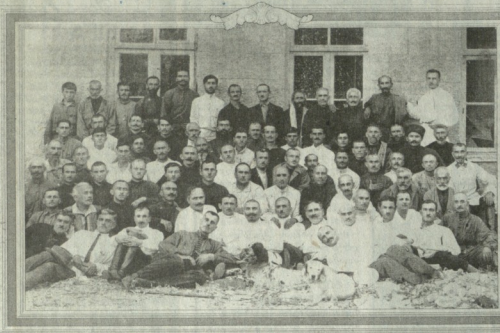
მს. შირინაძის ბათიში 1921 წელს გახსნულ ემიგრაციაში წახსენებულ განმავლზე მე...