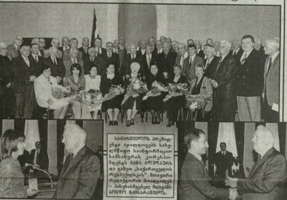
სახ კლამფეთს აღმშენებლობისათვის ტარებული შრომა ფუჭად არ ჩაივლის