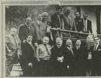
საქართველოს აკადემიის წევრები, ეკელას რაიე აქეს სახსოვარი...