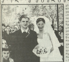
სტილით ბრძოლა... ფოტო გროსინების...