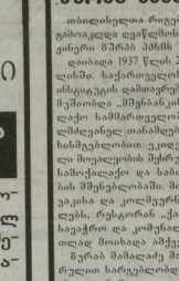
სსრკ... ახალი პოლიტიკური...