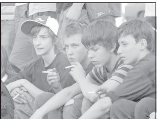
სკოლის მოსწავლეთა თითქმის ნახევარი თამბაქოს მოხმარებელია.

თამბაქოს კონტროლის ალიანსის ინფორმაციით, განცხადე-