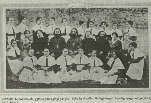
აქრემი ხინგარის კურსდამთავრებულები. მესამე რიგი, მარცხნიდან მეორე უფრო თავბრუსხვევით... მეგობრულად უფრო თავბრუსხვევით შეხვედნა უნდა აქრემ ხინგარს. მეგობრულად უფრო თავბრუსხვევით შეხვედნა უნდა აქრემ ხინგარს.