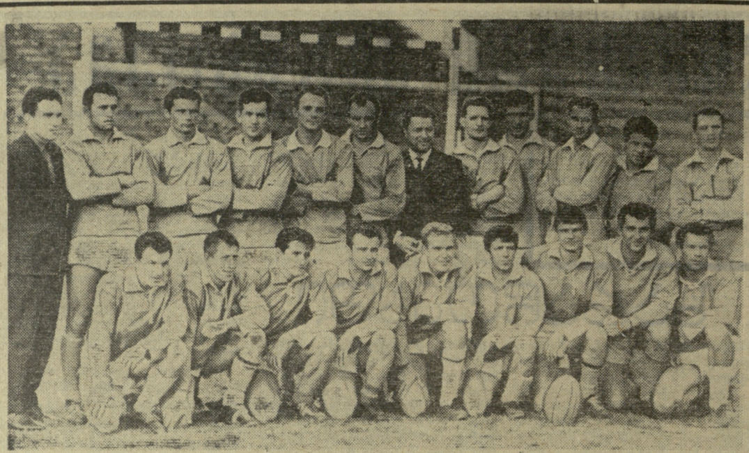
სურათზე: მოსკოვის ბაუმანის სახელობის უმაღლესი ტექნიკური სასწავლებლის რეგისტრაციის კოლეგია, რომელმაც თბილისში ამას წინათ გამართულ I საკავშირო შეჯიბრებაში გამარჯვება მოიპოვა.

წლისის პრემიერ-მინისტრმა ვილსონმა დიდი ბრიტანეთის ფეხბურთის ფედერაციებს წინადადება მისცა ჩამოაყალიბონ ერთიანი ლიგა, რომელიც თავის ჩემპიონატს მოაწივებს. ამ ლიგაში, პრემიერის