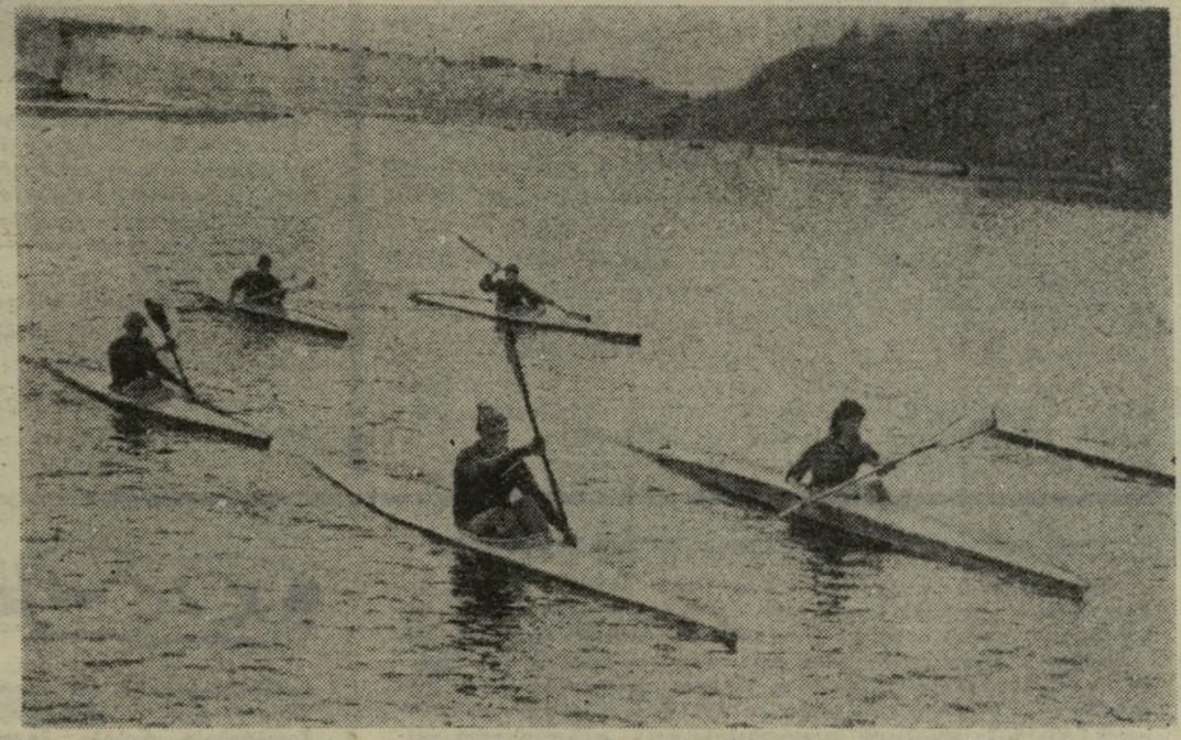
სსრ კავშირის საპარტიკო კლუბის 10 წლისთავი შეპირულად