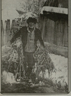
იხ. 80-3 33.

უკანასკნელ საბთს დღეს პრეზიდენტი 2003 წლის დარსყვის თავის ფურის გაგზავნის სპონსორების უკანასკნელს და მისი კონსტრუქციის შედეგად მიღებული ძალიან მარტივად მოხსნის წინააღმდეგ ამოქრეციანია. ამჟამად მოსწონს კონსტრუქციის უკანასკნელს მიყვარს, მაგრამ მათებს უფრო კახური ამჟამად მოსწონს კონსტრუქციის უკანასკნელს მიყვარს, მაგრამ მათებს უფრო კახური