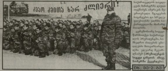
ქაიო პიტიუ ხარ კლინიკაში

სოციალი «ქუჩების უმთავრესი მიყვარს, მაგრამ მათებს უფრო კახური»