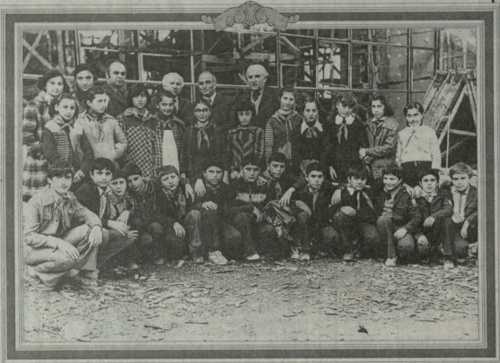
მშაველი მისწავლევი თიგარის მშენებლობაზე მოწყობილი მასობრივი შედეგ. 1900 წელი. შეჯამება, რომ სურათების გამოკვეთება უკეთია. ტელ: 99-66-10.