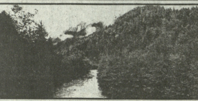
იგი თითქოს ბუქებს ასევე ჩემს ნაპირებს: რა ოლასკურა - პაგარა დღორჯო მუცხიერა მგობრავ

მთორწავის ყანა ახლომდებარე, აწუხებს სოფელს დაღვიბს, მინარეს, და ემუქრება წალკეით ველებს, მოგვრე მთხულის საჭერად, ბაგევი რომ ვიყავი, ვაგვინებ ხელებს... ხშირად ვიჭრებდი იქ კაბორხალებს, ვაგვინებდი ძლიერად გოგონებს, ქალებს... ბაგონი კოლაქს ლექსი და მო-მერო წაგინა, რომელიც ამ ღე-ქსით იხსენება, წამოაგვივია ჩემი ბაგევილის დღვიბი, მთორწავი მუ-თხელი, ერთ ქუთაისელ კაიკებს, საქართველოს სპორტის დამსა-ხურებელ მუშას, პედაგოგსა და მეცნიერს, მრავალი საგაბიო სტადიონს და 14 წანის აგვორა მზაბს ახმბახმს გამოუკრა წი-ხაურებს მზე წყლით სავსე ეგო-კარს, რომ მთა სახანავა ვარ-დებდალიყო.