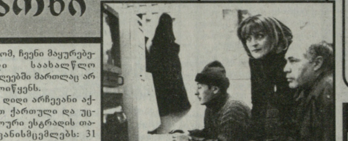
ირმა სოსხაძის ჯგუფი მუშაობს