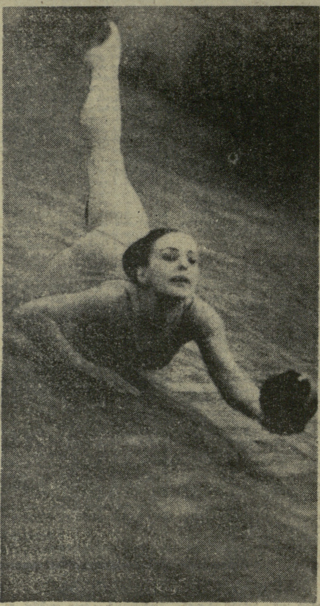
ჩვენს დედაქალაქში ახლახან გამართულმა მოსკოვისა და თბილისის უძლიერეს მხატვრულ ტანმოვარჯიშთა შეჯიბრებამ სპორტის მოყვარულთა დიდი ინტერესი გამოიწვია. ეს გასაგებიც იყო. სტუმრების გუნდში ხომ მსოფლიოში სახელგანთქმული სპორტსმენები ე. კარპუხინა და ლ. სავინკოვა გამოდიოდნენ. ამ უკანასკნელმა ბრწყინვალე ოსტატობა აჩვენა, მაგრამ I ადგილი თავის თანაქალაქელ კარპუხინას დაუთმო. ს უ რ ა თ წ ე: ლ. სავინკოვა ხანით ვარჯიშისას.