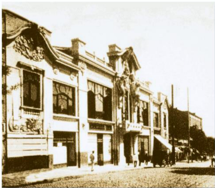
საქართველოს ეროვნული ბანკის შენობის ფოტო. 1919 წელი.