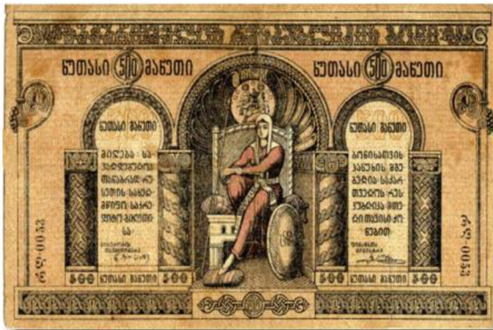
500 მანეთი, 1919 წ. ეკსიზის ავტორი იოსებ შარღეშანი.