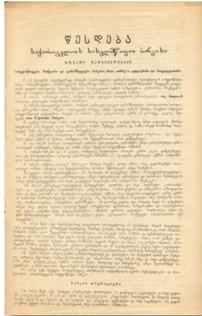
საქართველოს სახელმწიფო ბანკის წესდება (1919 წ.)