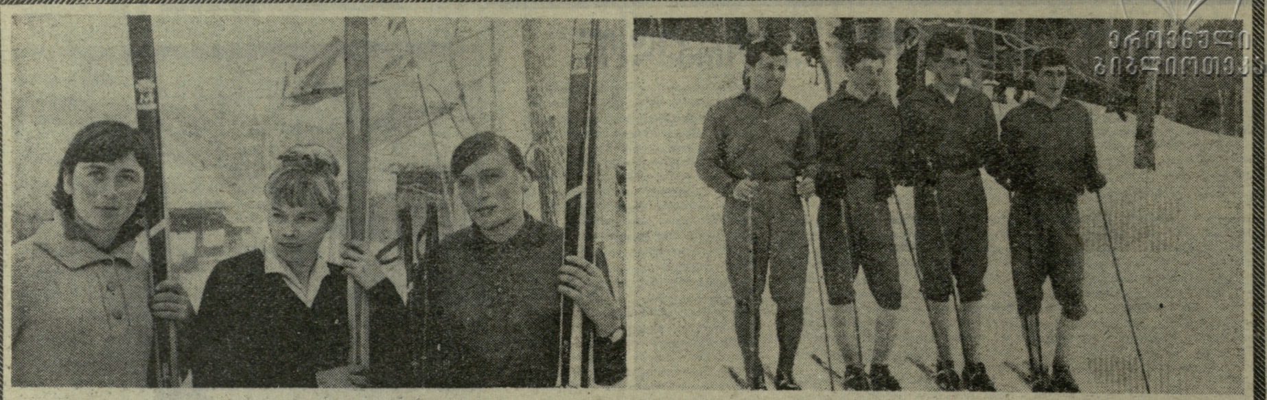
საქართველოს ჩემპიონები სათხილამურო სპორტში. მარცხნივ — თბილისის ქალთა გუნდი (მარცხნიდან: თ. ნაკანი, კ. კეხა და ნ. ბალაშვილი); მარცხნივ — ბორჯომის რაიონის ფოტო ო. გელაშვილისა.