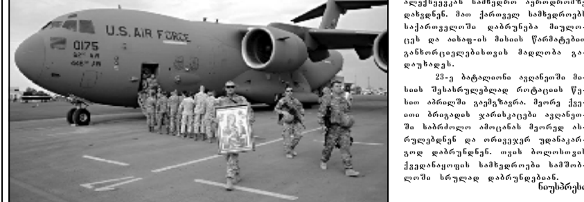
ავღანეთიდან სამომლოში დაბრუნდა საქართველოში დაბრუნდა მთელი ციხის და აისაფ-ის მისაის წარმატებით განხორციელებებისთვის მადლობა გადაუხადეს.

23-ე ბატალიონი ავღანეთში მისიის ამბადში ვაუმზავდა, მეთრე ქვეითი ბრძაღის ვარსკაცები ავღანეთში საბრძოლო ამოცანის მეთრე ასრულდნენ და ორავჯერ უღანიკარგოდ დაბრუნდნენ. თვის ბოლისთვის ქვედანიყოფის ხმხვერდობა სამომლოში სრულიად დაბრუნდებანი, ნუსხურსი.