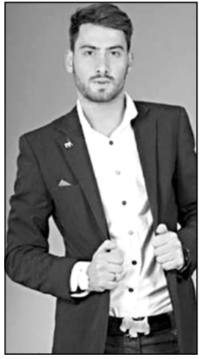
გიორგი ნაზაიძე საპარლამენტო მოხელეა. ეს ამბავი მოხდა...