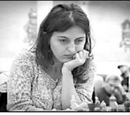
დღის ვეთი ვუნდა.

ნორვეგიის ქალქ ტრომსოში მომდინარე საქართველო ოლიმპიადისაზე მუდღეობისთვის ბრძოლის მანის ორევე ნაკრებში პრეტეკე-ვად დაიკარგა. თუ აქამდე ქალევის ქე მინდებოდა, მე-მ ტურში ურთი-ნახთან 1,5:2.5 წაყო და ბრძოლას ნაითშორდა.