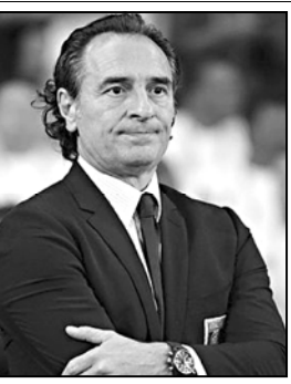
მიმწიდა მსოფლიო ფინანსილისა