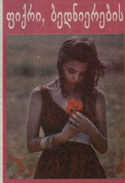
ფეჩი, ბენდიერების შეგებრებობი პტირი