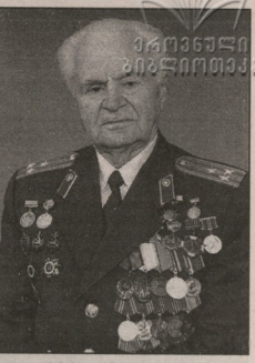
დიდი ხნის ჯანმოვლად და ხალხიან ცხოვრებას...