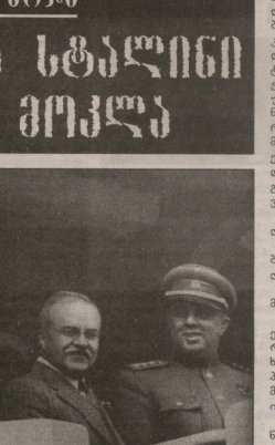
ლეთი და გულიანი გინგინა, რომელიც საბჭოთა კავშირის კოლმეობის წარმოქმნის მიზეზად...