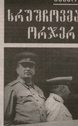
ლეთი და გულიანი გინგინა, რომელიც საბჭოთა კავშირის კოლმეობის წარმოქმნის მიზეზად...