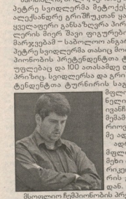
მსოფლიო ჩემპიონატის პრეტენდენტია ტურინში 2012 წელს გაიმართება.

მარიალია, ბოლო, მეთორ პარტიკა რუსეთის პატივს სცემდა მსოფლიო თასის, თანამშრომლობით დაქვემდებარებული ფინალური მსოფლიო თასის გათამაშების შემდეგ, რომელიც 2012 წლის 20-22 სექტემბერს მოეწევა მსოფლიო თასის გათამაშების თანამშრომლობით ფინალური სტადიონი. მსოფლიო თასის გათამაშების შემდეგ, რომელიც 2012 წლის 20-22 სექტემბერს მოეწევა მსოფლიო თასის გათამაშების თანამშრომლობით ფინალური სტადიონი.