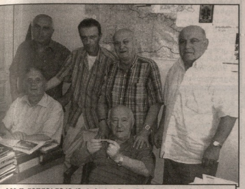
გიორგი ნივინიკიასი (ხას მარჯვნივან პირველი) გახდა საქართველოს რესპუბლიკის მრავალპარტიული ოპოზიციის ლიდერი. 2011 წლის ფელსი.