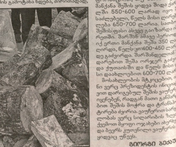
ბიძინა ვინჯიანი გადამდგამს მომზად