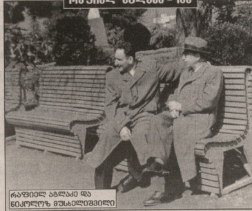
რეჟისორი ავღაძე - 100

რეჟისორი ავღაძე დაიბადა 1911 წელს 23 დეკემბერს თბილისში. მისი მშობლები ქართული მუსიკის ცენტრების ცნობილი წარმომადგენლები, გაზეთ „კვირის“ რედაქციის თანამშრომლები იყვნენ. მისი მშობლები იყვნენ: მუსიკალური ინსტიტუტის დირექტორი ილია ქაყანიძე და მუსიკალური ინსტიტუტის დირექტორი ილია ქაყანიძე.