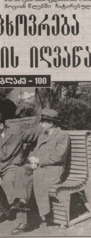
რეჟისორი ავღაძე - 100

ყოფის საკმეს. ჯერ კიდევ ნახევარ საკლასურ მუსიკის ნიშნით ი. ავღაძის მიერ წამოყვანილი ბული კონცერტების სახით იმის ტიტულს მიიღო და ქართული მუსიკის მიმართული კომპოზიტორების შემადგენელი ძალები ატყუებულნი და სხვათა ჩვენი ქვეყნის მიწვევების ძირითადი არობალების რაციონალურად გადამკვირვების გზებს. ი. ავღაძის და მისი მოწვევების მიერ შექმნილი მანერები მისი კამპანიების ყველაზე მთავარი აღმასრულებელი პროდუქტების – დაიბეჭდვების მისი მისი ტექნიკური, რისთვისაც უტერ მუსიკის უმაღლესი სახელმწიფო ორდენი მიენიჭა. 1956 წელს რუსეთში რაფიელ ავღაძის ტექნიკური შეიქმნა კალუშის ჯერმანეთის წარმოება. სამკლავობით იოსებ ნაძვლის რეჟისორი.