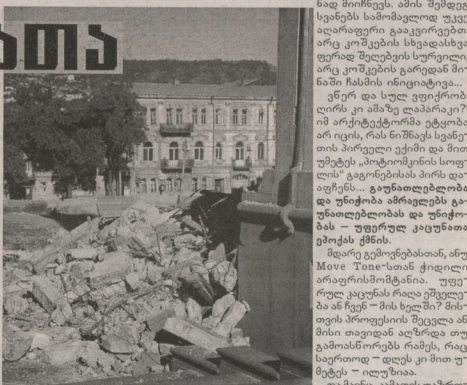
პეტე, ურთიანთი ფსახებზე სეგნები, სამ-ნუხარო, შეგვერ, მაგრამ სამსაზრებზე მათ შინაც სერიუხად არ უბუბო. სემ-მე ის არის, რომ მქვილი სამსაზრებზედამ...