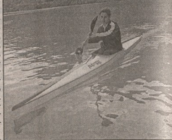
800 მ. ერთადერთიანი ბიბლია... საორბტი გეგმარაზა...