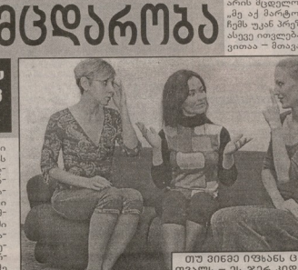
თუ მიხედო იხორკავთა ცხიპრის ან იხორკავთა...