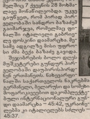
ფსხვურები „ბიზნესლ“ დასაპირღინე.