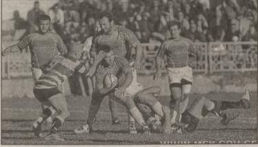
საბავშვო ეროვნული ჩემპიონატის ფინალში „აია“ უანსი 16 წლის უეილზე დაჯილდოვდა.