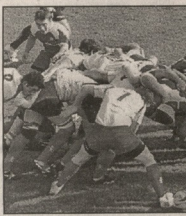
საქართველოში მორავტეა დაჯილდოვდა.