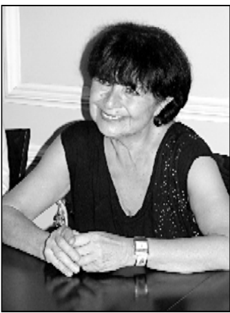
ღამის სარედაქციო თბილისი ჩამოვიდა

წინა წლების მსგავსად, წლებიდან ფესტივალზე შეიკრებიან რიგი კარგადი, ისე უცხოელი ცნობილი მუსიკოს-მუსიკოსები. მათ შორის აღსანიშნავია დიმიტრი გინტარის რეკვირუსი, „საქართველოს კარგადი“ ადამიანები სერგეი ნაიკარაძე, შუბერტის მონაწილეობის მსახივრე სახელები კარგადი მუსიკოსები ღამის სარედაქციო თეატრში და 3 სექტემბერს რუსთაველის თეატრში დასკვნითი კონცერტი გაიმართა.