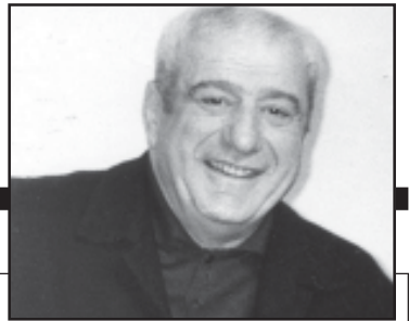
ჩვენი „ჩაპრული“, „სორული“, ჩვენი „ვეფხვი და მოყვია“, ჩვენი „საქართველოს ბიზნესი“ არ მოკვდა, ჩვენი „საქართველოს ბიზნესი“ არ მოკვდა!

● არც ერთ მონარქს არ დაუტოვებია ერის ისტორიაში ისეთი ღრმა და შთაბეჭედავი კვალი, როგორც თამარმა დატოვა