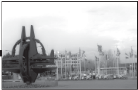
რის მოაღივლა მომიჯნოებო, თქვენთვის ებაც მეტიყო.

● დღეს საპარტოვო შურნალისტებზე კალაღობა და მათი საქმიანობის ხელის შეშლა უკვე სისტემატური გახდა, განსაკუთრებული ცინიზმითა და სისასტიკით გამოჩენილი თანამდებობის პირების უმრავლესობა კვლავაც ინარჩუნებს თანამდებობას და არ დასჯილან