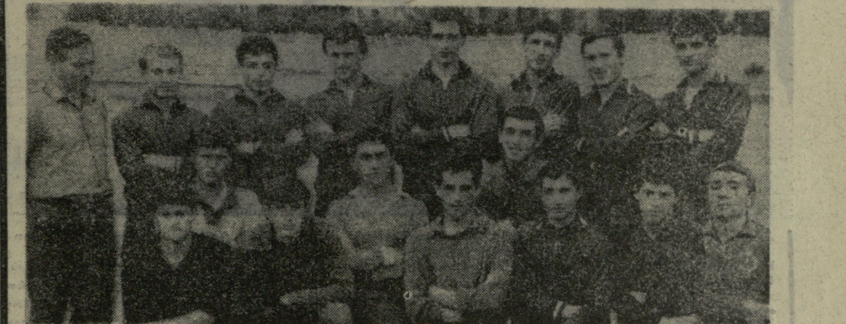
ოსტატ ფეხბურთელთა გუნდებთან არსებული მოხარულთა მოსამზადებელი ჯგუფების საკავშირო ნახევარფინალურ ტურნირში კვლავ წარმატებით გამოვიდა თბილისის ახალგაზრდული საფეხბურთო სკოლის გუნდი (მწვრთნელი — სსრ კავშირის დამსახურებული მწვრთნელი ვ. ელოშვილი). ჩვენმა გუნდმა საუცხოოდ ჩაატარა თავისი უველა შეხვედრა, დამსახურებულად დაიკავა I ადგილი და მოიპოვა უფლებამოსილება მიიღოს ფინალურ შეჯიბრებებში. აღსანიშნავია, რომ თბილისელთა კოლექტივი მეტყველდ მონაწილეობს ფინალში. ასეთი მაჩვენებელი არა აქვს არც ერთ სსრ გუნდს. ნახევარფინალური შეჯიბრება მიმდინარეობდა დნეპროპეტროვსკის ოლქის ქ. ვოლნოვოდსკიში. თბილისელმა ფეხბურთელებმა დაამარცხეს ალმა-ათის თანაკლებელები (2:1), მახაჩკალის „დინამო“ (2:0), დნეპროპეტროვსკის „დნეპრი“ (1:0), ხერსონის „ლოკომოტივი“ (4:0) და ფრედ (2:2) ითამაშეს ტაშკენტის „სტარტთან“.

„შეპარდენა“ ფრთები გაშალა გუნდში თბილისის „დინამოს“ სტადიონზე, „კლასის უმაღლესი“ ჯგუფის წარმომადგენელთა კალენდარული მატჩის წინ შედგა ფინალური შეხვედრა „ტყაის ბურთის პრინცი“ უფროსი ასაკის ნორჩ ფეხბურთელებს გუნდებს შორის. ერთმანეთს შეხვედნენ „მეტროპოლი“ (თბილისი) — „მეტალურგი“ (ქუთაისი). გაიმარჯვეს სტუმრებმა — 2:0.