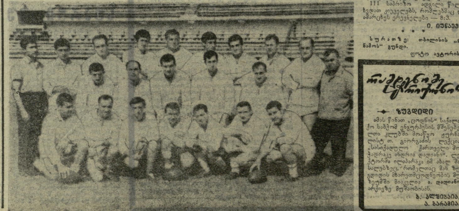
თბილისის „დინამოს“ გუნდი.