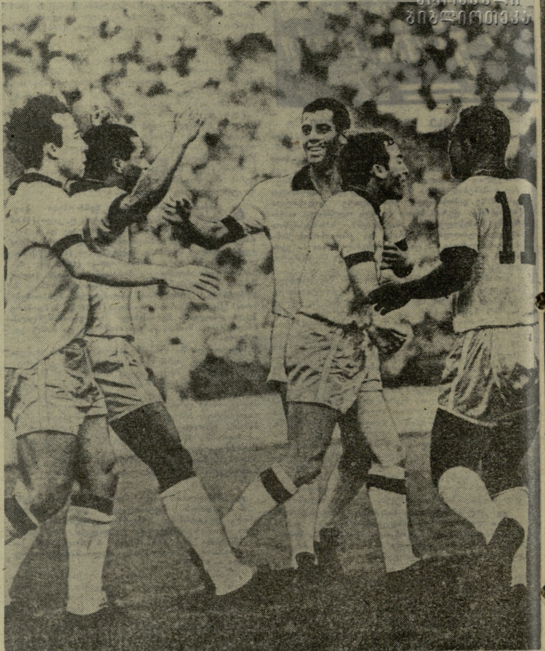
ეროვნული გუნდის ფეხბურთელები