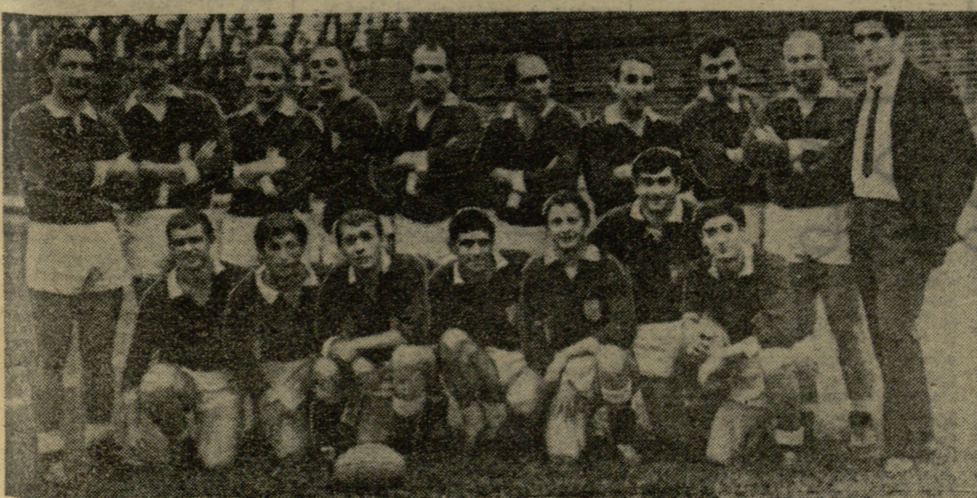
როგორც ვიტყვობინებოდით, კორიორში დამთავრდა რეპიონტის I საკავშირო ჩემპიონატი...