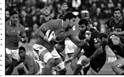
ნაი დატვიტონის ნაკრების მთლიანი ალფიზი არ ნაკრების შირის ვანსხეველები შეხვედრაში

ლოზიყარი იარსი ზონალებთან დანდასთან გეპქებს და შევიდომებს გაიხსრონების უნდა შევიდომები. თითოეულ შეხვედრაში ვსწავლობ და ვეუბრებო ხარვეზებს. შიგნით ტრეპაში წვენი დაეცა და შერქინება ძალიან ფერს.