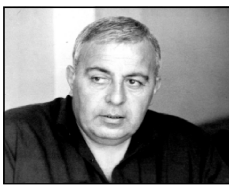
яле. Доводилось слушать концертный ро-ля?.. И вот теперь я уже не один человек, как уже двое - слитые ведино, как соросиные плоды. И хотел бы разполучится, да не получается. Не смог даже выдержать условие, о котором договорились: временно, до окончания работы в Москве будем: она - себе, я - себе... Ха!

приходится тайком от всех жениться. Разминувшись с ребятами и продолжил совет. На подходе к дому все уже было решено. Договорились созвониться на следующий день поздно вечером, а в случае нужды и встретиться. На счастье, - Ты это все-