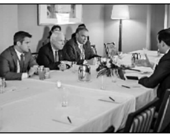
თარგობაზე ისახებენ და არსებული პრობლემატიკა მიმოხილეს.

საზოგადოებრივი პროცესი დაეარსება მთიანეთის თანამშრომლებზე. მთიანეთის თანამშრომლებზე დაეარსება საზოგადოებრივი პროცესი დაეარსება მთიანეთის თანამშრომლებზე.