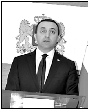
დროს ადგილი ჰქონდა ხსტმურ დანაშა-ულს, ისეოებს, როვორცია ადამიანების

მოაერობის ხელმძიხე გუშინ ბრეჟი-ერ-მინისტრია ყოფილე ბრეჟიდეტის მახე-ელ სააკაშვილისთვის ხანდრო ვინფლიან-ის საქმეზე ბრალის დამაჟიხა შეჯიხისა.