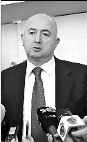
ვინის ვანცხადებით, თუ ე.წ. ხელშეკრულებ-ბა თუკონებულ ცინვალთან ვაფორ-მდება, ის, აფხაზეთის მხეჯახედ, უკანონო იქნება.