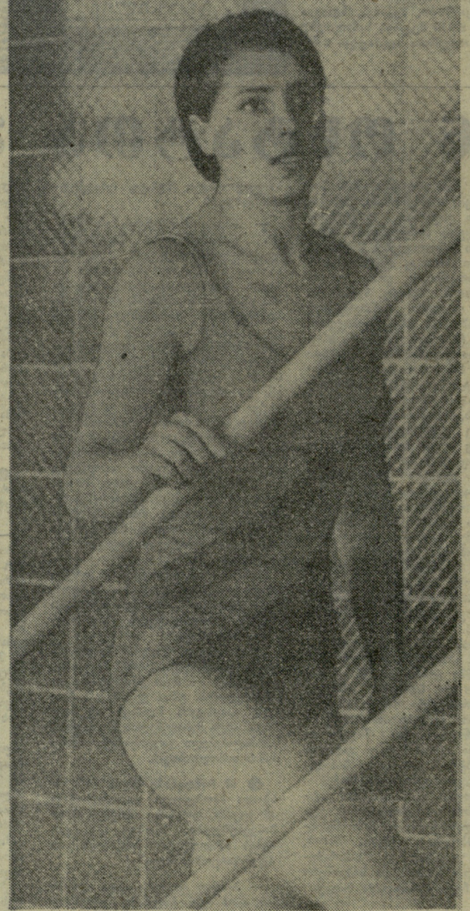
სურათზე: ა. კალიაგინა.