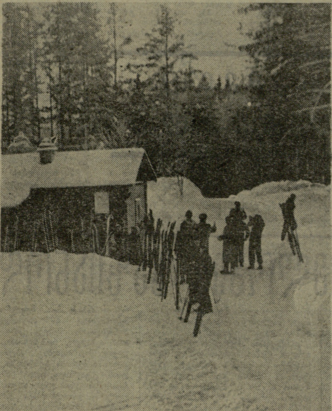
ამ დღეებში საბჭოთა კავშირის სხვადასხვა ქალაქის ათასობით მოთხოვნილი და ტურისტები აწყობს ლაშქრობას ვ. ი. ლენინის ცხოვრებასა და მოღვაწეობასთან დაკავშირებულ ადგილებში.

ს უ რ ა თ ვ ე: ტურისტ-მოთხოვნილებები ილირიფოში, ხახლთან, სადაც ვ. ი. ლენინი დროებითი მთავრობის ჯამბუჯის ემბლეზაა.