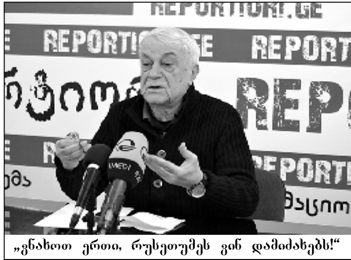
„ვინასოთ ერთი, რუსეთუმეს ვინ დამიბახებს!“