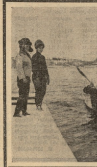
მოსკოვი, სსრ კავშირის სახალხო შერჩევის...