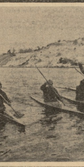
შაბანაძის სსრ კავშირის...