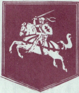
ლიტვის დროშა და გერბი

მთელი მსოფლიოს ყურადღება ახლა ლიტვისკენაა მიპყრობილი, რადგან ლიტვის საბჭოთა რესპუბლიკის საბჭოთა კავშირის დაშლის შემდეგ, რისი პირობებიც საჭიროა შევთანხმდეთ მოსკოვთან. ლიტვა, წინასწარ საჭიროა გავარკვეოთ ის პირობები, რომლებიც ჩვენ ვაწარმოებთ მოლაპარაკებას. ჩემის აზრით საბჭოთა მხარეს ეშინია იმის, რომ ლიტვის დემოკრატიული მოსაპარაკებო იქნება ჩვენი სუვერენობის ფაქტური აღიარება. ჩვენ არ გავუზრდობართ არაოფიციალურ კონტაქტებს, მაგრამ ვალდებულების აღება შეგვიძლია მხოლოდ იმ შემთხვევაში, თუ ჩვენ გვცნობენ როგორც დამოუკიდებელი სახელმწიფოს წარმომადგენლებს.