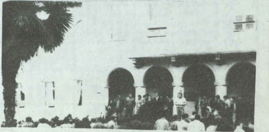
როგორც შემდეგ შევიტყვეთ სტუმრად თეატრალის ორგანიზაციის მიერ ქალაქის ცენტრში ჩამოყალიბდა იქნა ლენინის ძეგლი.

მიტინგის შემდეგ თეატრალში ჩამოყალიბდა საპარტიო გროუპი და დამოუკიდებლობის პარტიის ალტერნატივი ორგანიზაცია, რომელსაც სათავეში ჩაუდგა სტუმრად ეროვნული აქტივისტი დავით ჯუბაბაძე.