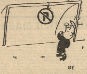
ს. ბ. ვაშლიანი