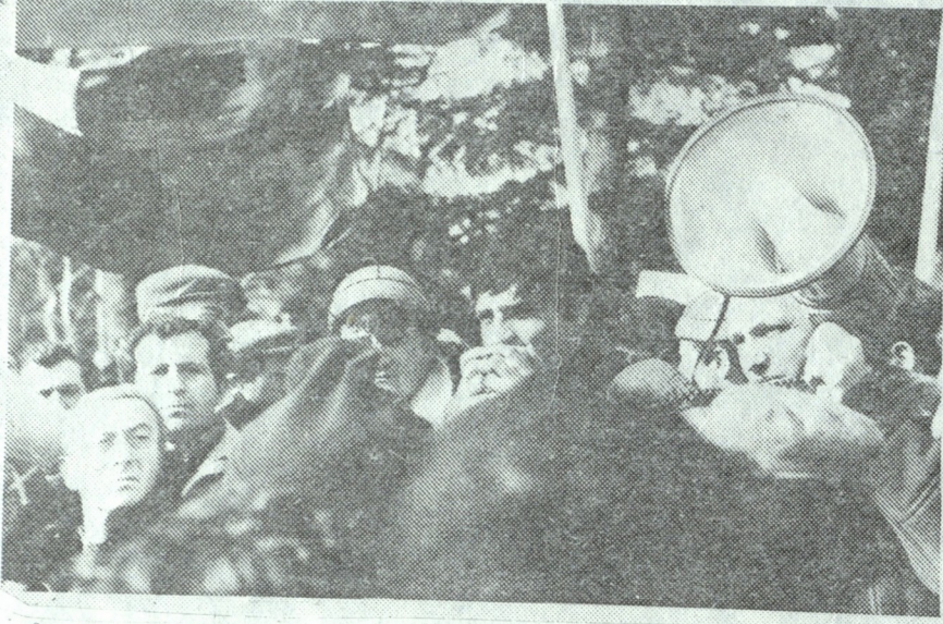
25 თებერვალს თბილისში, შავრობის სახლთან გაიმართა მიტინგი, რომელიც მონაწილეობა მიიღეს საქართველოში არსებული ყველა საზოგადოებრივ-პოლიტიკურმა ორგანიზაციებმა.

23 თებერვალი. შავრობის სახლთან დაწყებულმა აქციამ ამიერკავკასიის სა- მხედრო ოქტის შტაბის წინ გადაინაცვლა. აქ გაიმართა მიტინგი, რომელზეც სიტყ- ვით გამოსულებმა დაგმეს წიხელი არმიის მიერ 1921 წელს საქართველოს ოკუპაციის ფაქტი და მოითხოვეს, რომ საოკუპაციო ჯარებმა დასტოვონ საქართველოს ტერიტორია.