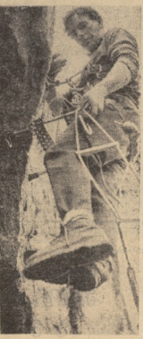
სსრ კავშირის პირველი