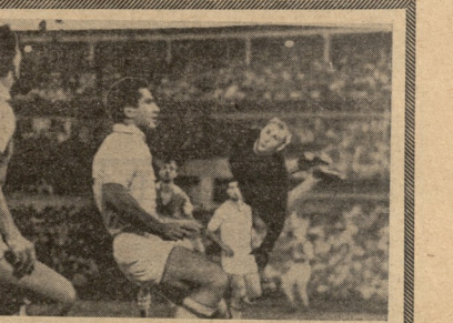
თბილისის დინამოს მფობრის წევრები... 1965 წლის 13 მარტიდან...