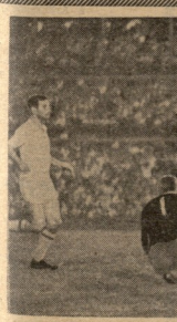
თბილისის დინამოს მფობრის წევრები... 1965 წლის 13 მარტიდან...