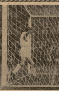
თბილისის დინამოს მფობრის წევრები... 1965 წლის 13 მარტიდან...