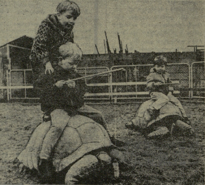
დასავლეთ-გერმანული ილუსტრირებული ჟურნალი „ეკვიკი“, რომელიც ნახევარმილიონიანი ტირაჟით გამოდის, თითქმის ყოველ ნომერში აქვეყნებს ფოტოსურათებს. ერთ-ერთ ასეთ „სენაიცას“ დღეს გთავაზობთ.