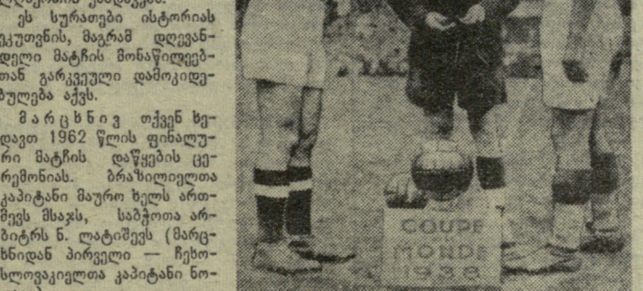
მარჯვნივ: 1938 წლის ფინალური მატჩის დაწყების წინ ერთმანეთს ეხალმობიან იტალიელთა კაპიტანი მეაცა (მარცხნივ) და უნგრეთის ნაკრების კაპიტანი შაროში.

ფეხბურთის მოყვარულებმა კარგად იციან, რომ დღევანდელი ფინალისტები — ბრაზილიისა და იტალიის გუნდები სხვადასხვა წლებში უკვე ორ-ორჯერ იყვნენ მსოფლიო ჩემპიონები და დღეს წყდება საკითხი, თუ ვინ უნდა მიიღოს ამ ორი გუნდიდან სამუდამო მფლობელობაში ოქროს ქალღმერთის ქანდაკება. ეს სურათები ისტორიის ეკუთვნის, მაგრამ დღევანდელი მატჩის მონაწილეებთან გარკვეული დამოკიდებულება აქვს. მარცხნივ თქვენს ხელდავთ 1962 წლის ფინალური მატჩის დაწყების ცერემონიას. ბრაზილიელთა კაპიტანი მაურო ხელს ათმეგ მსაჯს, საბჭოთა არბიტრს ნ. ლატინსკის (მარცხნიდან პირველი — ჩეხოსლოვაკიელთა კაპიტანი ნოვაკი).