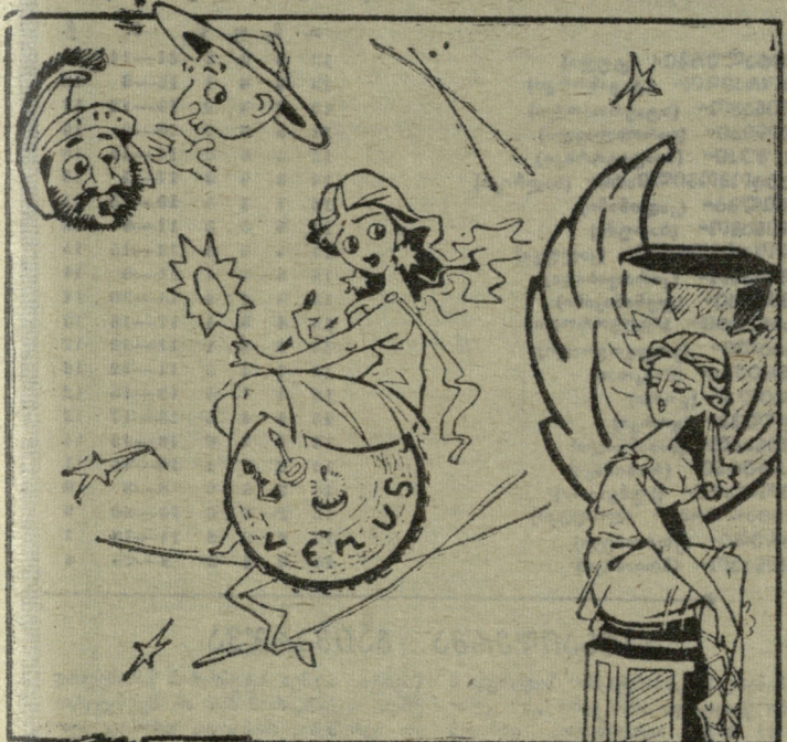
— შორჩა, ველარ იტორავებთ ჩემზე: ხელიდან ხელში გადადისო... გ. იაშვილის ნახატი.