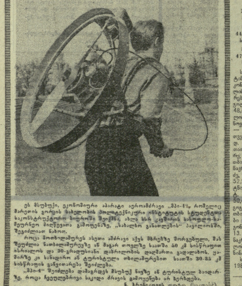
ეს მსუბუქი, ეკონომიური აპარატი აგრამაჩავი „მია-1“, რომელიც მართვის გორების სახელობის პოლიტექნიკური ინსტიტუტის სტუდენტთა საკონსტრუქციო ბიუროში შეიქმნა, ახლა სსრ კავშირის სასოფლო-სამეურნეო მინისტრატის გამოცნაზე, „სახალხო განათლების“ პავლიონში, შედგენილია ნახოთ.