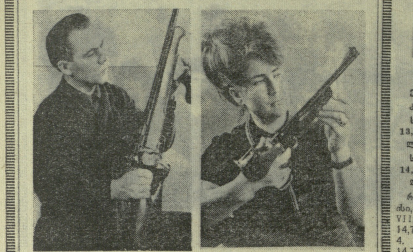
ჩვენს ქვეყანაშიც და უცხოეთშიც დიდი პოპულარობით სარგებლობს სპორტული და სახალისო იარაღი, რომელსაც ტულის იარაღის ქარხანა უშვებს. სპორტულ პისტოლეტს ტოზ-მ-ს, სპორტულ რევოლვერს ტოზ-მ-ს და სპორტულ შაშხანას მ-ც-12-ს ხარისხი ნიშანი მიანიჭეს.